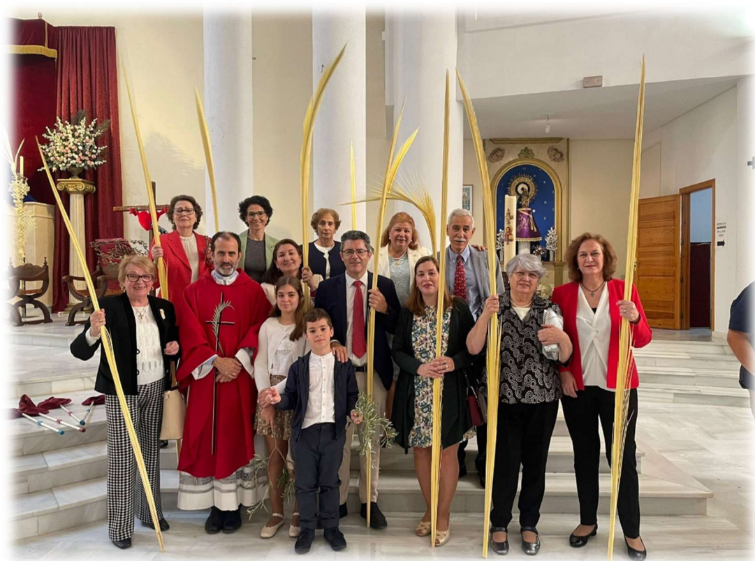
FOTO: PRIMERA COMUNIDAD EN EL DOMINGO DE RAMOS 2024 QUE FINALIZAN SU ITINERIO DE FE

Una vez terminado el Camino, la comunidad continuará en la parroquia procurando dar signos de fe, viviendo en humildad, sencillez y alabanza, en lo que se llama la Educación Permanente en la fe, que acompaña a los hermanos hasta el final de sus vidas